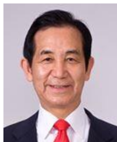
来賓挨拶 元地方創生担当大臣 山本幸三