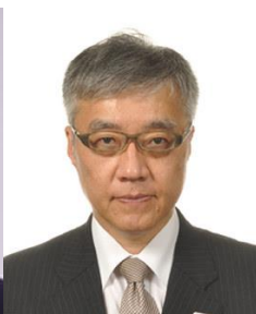
来賓挨拶 文化庁次長 中岡 司