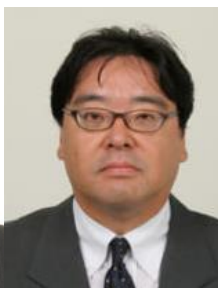
来賓挨拶 文部科学省高等教育局長 伯井 美徳