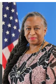
代表挨拶 駐大阪神戸米国総領事 かれん・ケリー